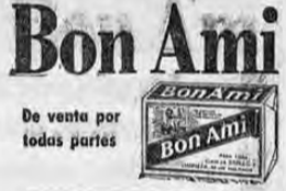
Bon Ami De venta por todas partes