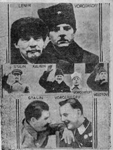
(Arriba) Klementi E. Voroshilov, defensor de Leningrado, era ya un héroe en la época de Lenin con quien aparece retratado. (Centro) Los cuatro ases del bolchevismo en una ceremonia reciente: Stalin, Kalinin, Voroshilov y Molotov. (Abajo) José Stalin y su gran amigo el mariscal Voroshilov en uno de sus momentos expansivos.

Así habló el mariscal Klementi Voroshilov el 21 de agosto, en una alocución al pueblo en la que recordaba la gravedad de la situación como consecuencia del ataque alemán sobre la vieja San Petersburgo. E instaba a los ciudadanos a que se dispusiera a sacrificar sus vidas en la tarea de rechazar al agresor. A los 7 años trabaja Voroshilov 12 horas diarias Los nazistas parecen convencidos de que Voroshilov no les entregará la vieja corte de los zares "para impedir la destrucción de sus reliquias históricas". Si los germanos intentan el asalto de la ciudad, cada casa de Leningrado será un fuerte y cada habitante capaz de disparar un arma, un soldado dispuesto a vender cara su vida. En otra ocasión dijo el defensor de Leningrado a quien se considera como el líder más popular de Rusia: El Ejército Rojo es una maquinaria defensiva, no ofensiva, pero sus soldados están siempre dispuestos a combatir por una causa justa. Por esa causa sabrán morir con la sonrisa en los labios". Klementi Eremovitch Voroshilov, primer mariscal de la Unión Soviética, nació el 3 de febrero de 1881 de Verkhni, en el distrito de Yekaterinoslav de la Ucrania. Los rusos lo llaman "Clim" y a menudo se le ha mencionado como "posible sucesor de Stalin". Su padre, Erem, era sereno del "PASA a la Pág. DIECISEIS"