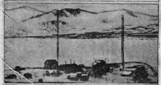
Mapa del norte de Europa que demuestra la importancia estratégica de las islas Spitzbergen, donde desembarcaba recientemente una expedición británica y la estación de radio de West Spitzbergen, usada frecuentemente como base en las exploraciones del Polo Norte.

PARA LLEGAR A ELLAS, LA FUERZA EXPEDICIONARIA INGLESA TUVO QUE HACER UN RECORRIDO DE 2.500 MILLAS. — NO SE HA EXPLICADO NUNCA LAS CAUSAS POR LAS QUE LOS ALEMANES NO LAS HUBIESEN OCUPADO