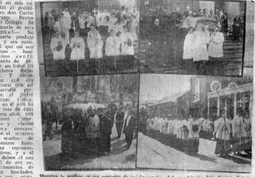
Muestra la gráfica cuatro aspectos de los funerales del presbítero don Carlos Trapp, rector del colegio Seminario.

Antenoche falleció en esta capital el presbítero don Carlos Trapp, Rector del Colegio Seminario de este capital. Su muerte fue producto de una enfermedad que así ocurrió — horrible y doloroso — horroroso sentimiento de pesar, en todos los sectores sociales. Y decimos que era natural que así ocurriese porque el padre Trapp educó en el país más de cuarenta años, con cuánto cariño y rectitud y en sus clases muy sinceras. Fue el maestro de muchos de nuestros hombres representativos; y a él le deben el capital de sus conocimientos, de sus bondades, de sus virtudes. Por varios años sirvió la Rectoría del Colegio Seminario, con singular actividad. Tuvo, en la rama de la enseñanza pública del país, una destacada actuación, que siempre se recordará con infinito cariño. Sus funerales tuvieron lugar ayer en la mañana en la Catedral, con asistencia de numerosos elementos del Clero y de las distintas clases sociales. Ofició el señor Arzobispo, Monseñor Sanabria.