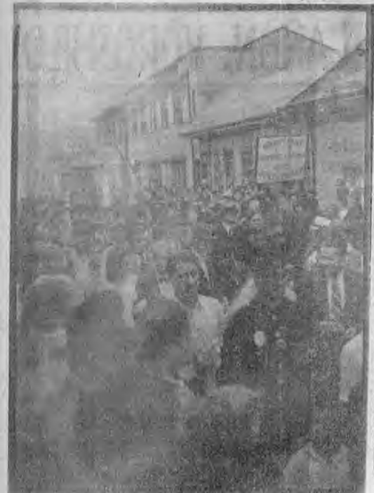
Uno de los aspectos de la manifestación anti-totalitaria celebrada el 15 de setiembre en esta capital, pudiendo apreciar...