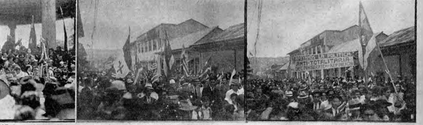
Cuatro magníficas fotografías de la manifestación antitotalitaria celebrada el lunes 15 de setiembre en esta capital, en las que puede verse los distintos grupos de manifestantes cuando desfilaron hacia el Templo de la Música, así como de la tribuna que se instaló en el Templo, desde la cual fueron pronunciados los distintos discursos. Los distintos grupos portaban las banderas y estandartes de los respectivos países, como podrá verse en las fotos.