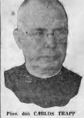
Phro. don CARLOS TRAPP

Antenoche falleció en esta capital el presbítero don Carlos Trapp, Rector del Colegio Seminario de este capital. Su muerte fue producto de una enfermedad que así ocurrió — horrible y doloroso — horroroso sentimiento de pesar, en todos los sectores sociales. Y decimos que era natural que así ocurriese porque el padre Trapp educó en el país más de cuarenta años, con cuánto cariño y rectitud y en sus clases muy sinceras. Fue el maestro de muchos de nuestros hombres representativos; y a él le deben el capital de sus conocimientos, de sus bondades, de sus virtudes. Por varios años sirvió la Rectoría del Colegio Seminario, con singular actividad. Tuvo, en la rama de la enseñanza pública del país, una destacada actuación, que siempre se recordará con infinito cariño. Sus funerales tuvieron lugar ayer en la mañana en la Catedral, con asistencia de numerosos elementos del Clero y de las distintas clases sociales. Ofició el señor Arzobispo, Monseñor Sanabria.